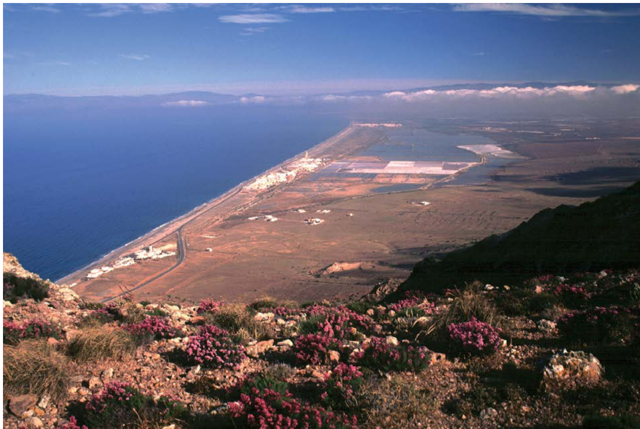
Figura 3.24. Salinas de Cabo de Gata.

Otra de las actividades ligadas a la producción salinera es la ganadería que, como sabemos gracias a los importantes trabajos de investigación de los últimos años, tuvo un relevante desarrollo en el Campo de Níjar. De manera, que se ha ido poniendo el foco en cómo la ganadería no solamente utilizaba los herbajes en la hoya litoral, sino que se aprovechaba la existencia de espacios salineros que permitían a los ganados una provisión suficiente de sal. Para Malpica (1991, 72-75), las salinas almerienses tienen una estrecha relación con la ganadería y, de hecho, defiende que la organización de los territorios granadinos permitió el desarrollo de esta actividad, algo que se aprecia en las Salinas de Dalías.