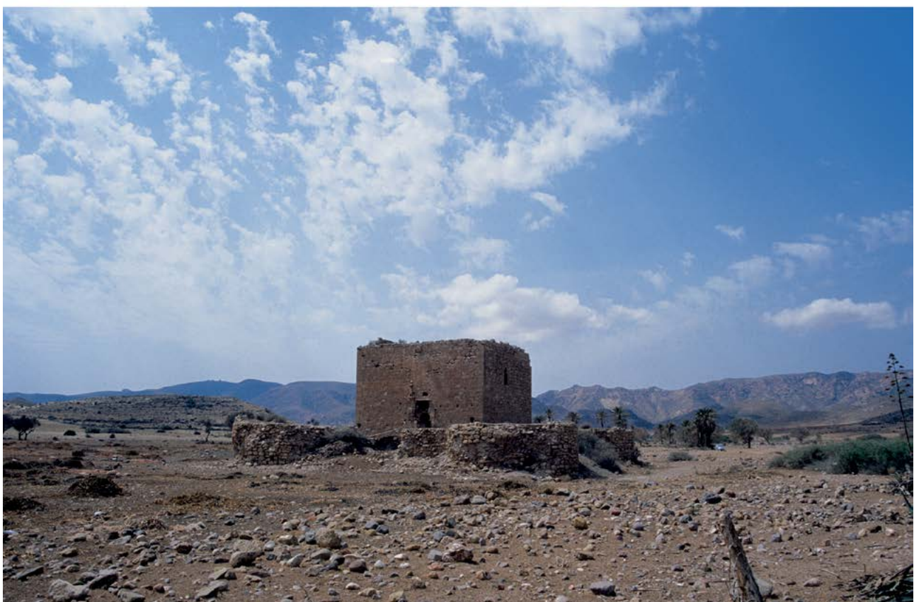
Figura 3.25. Panorámica de las minas de Rodalquilar (Níjar) y Torre de los Alumbres.

transmiten la información que procede de prácticas anteriores. En nuestra comarca, el 31 de agosto de 1526 se autorizó al doctor Carvajal a efectuar prospecciones mineras en el Cabo de Gata y en el de Sabinón (Cara 1986, 22).