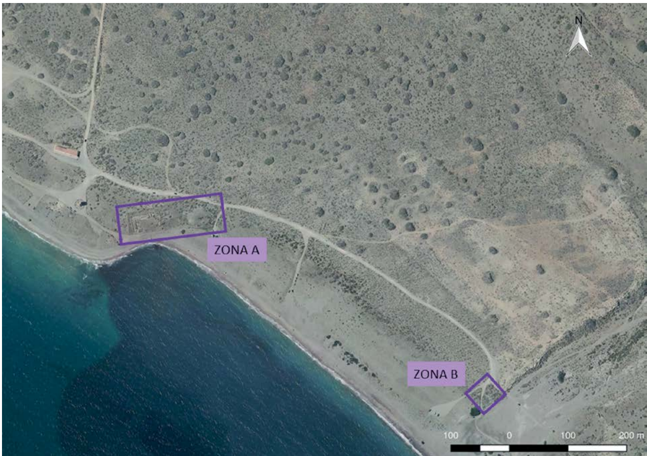
Figura 4.2. Torregarcía: zonas tras los primeros trabajos.

Cultura de Almería en el expediente de dicho yacimiento, en la que se hacía una valoración de este enclave.