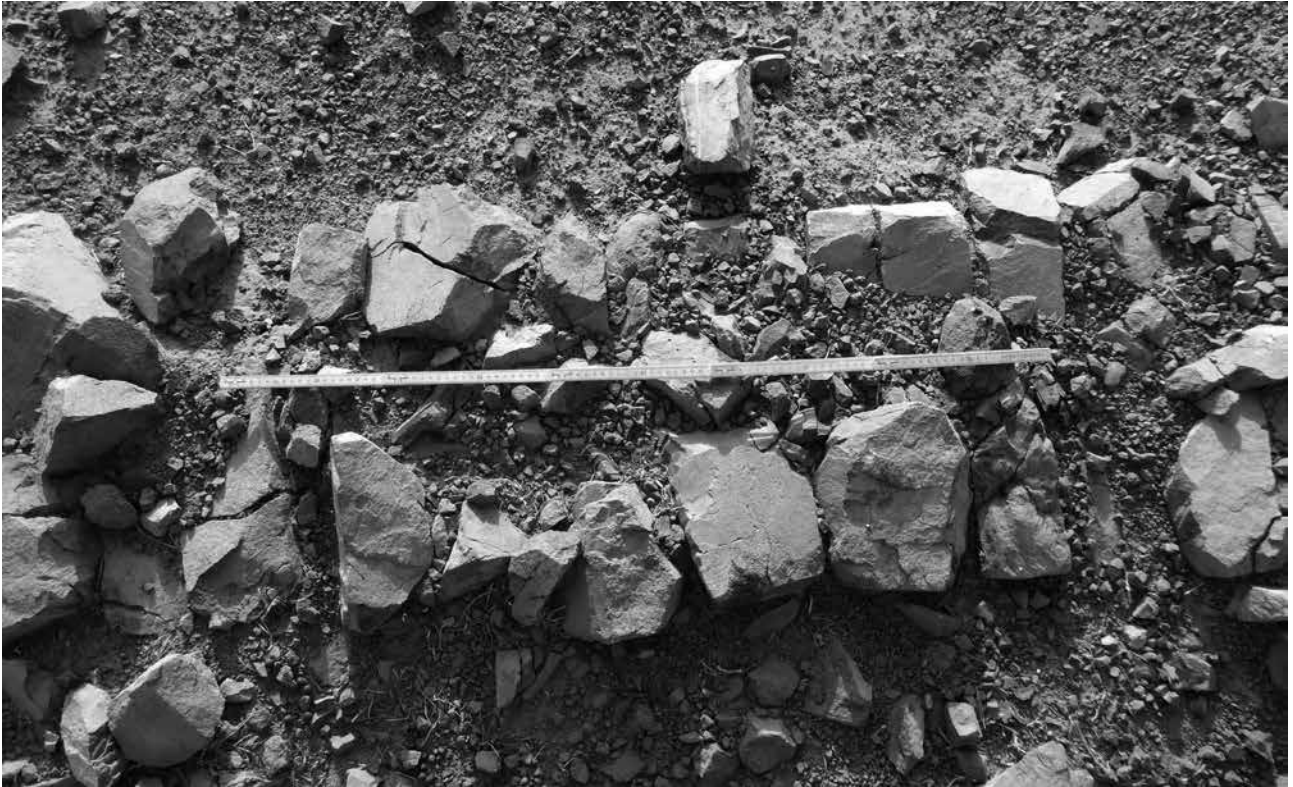
Figure 6.32. Hamdallaye, vue des parements des assises de la muraille.