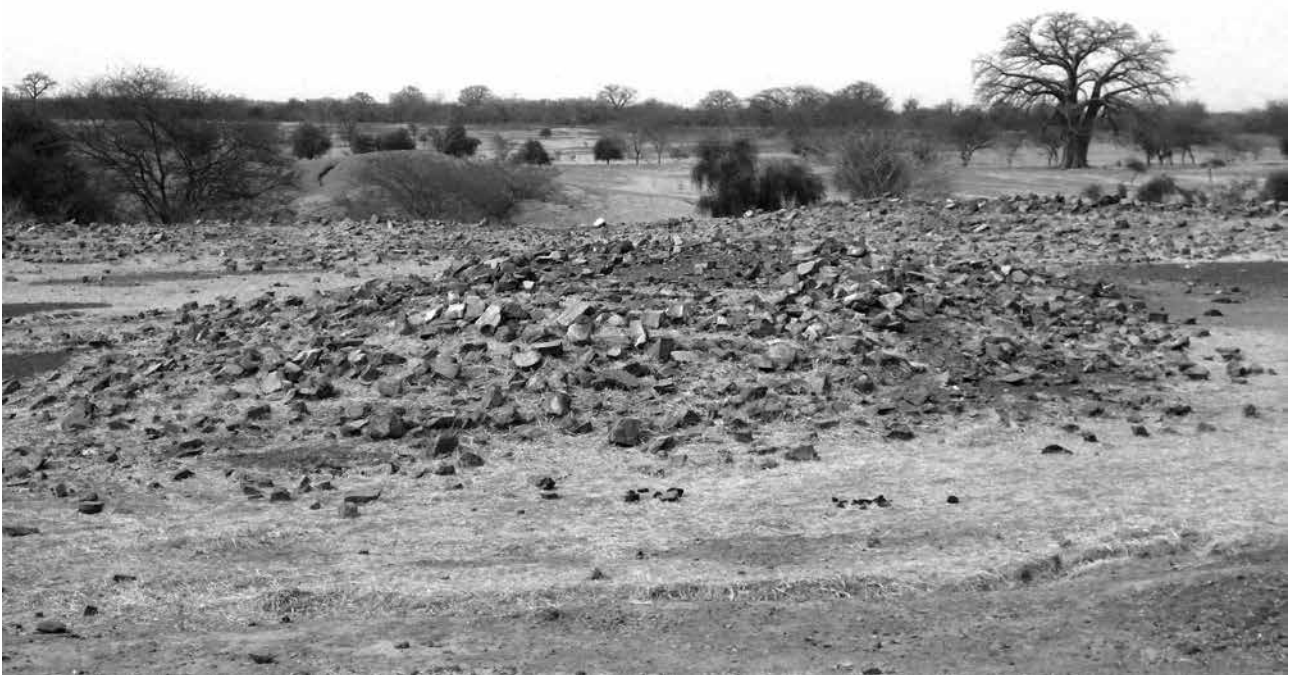
Figure 6.33. Hamdallaye, vue de l'éboulis de la structure intérieure du tata au premier plan. Au second plan, l'éboulis de la muraille.

Bathily. Son père Hamadi Bathily a refondé le village d'Hamdallaye vers 1950, et ce dernier lui aurait dit que le tata fut construit par l' almamy Bokar Saada (Boubakar Saada) peu après le passage d'El Hadj Omar Tall. Dans son enfance, Abdoulaye Bathily a vu les pans de mur du tata encore en élévation. Il se souvient que ce tata avait