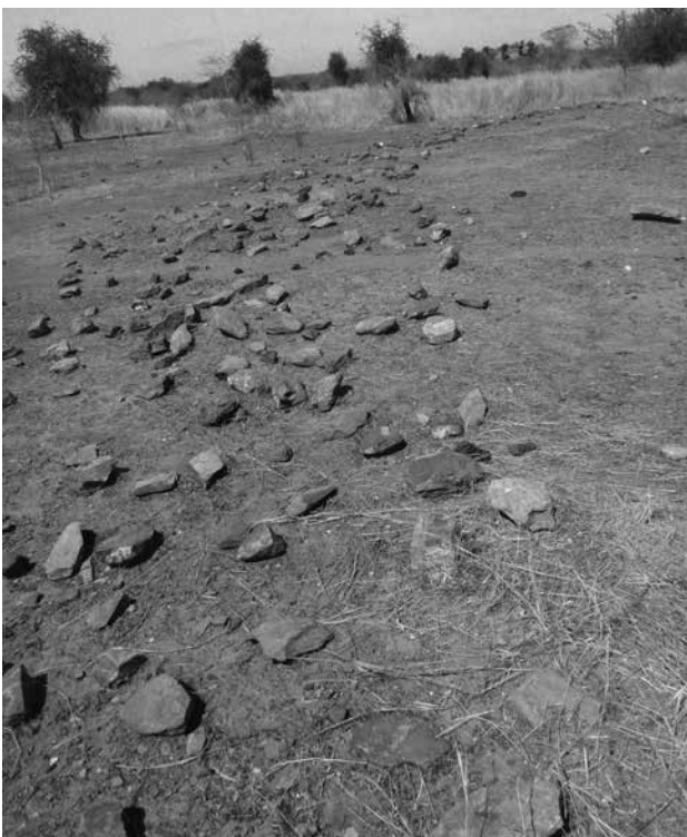
Figure 6.35. Darra-Lamine, étalement de l'éboulis de la muraille.