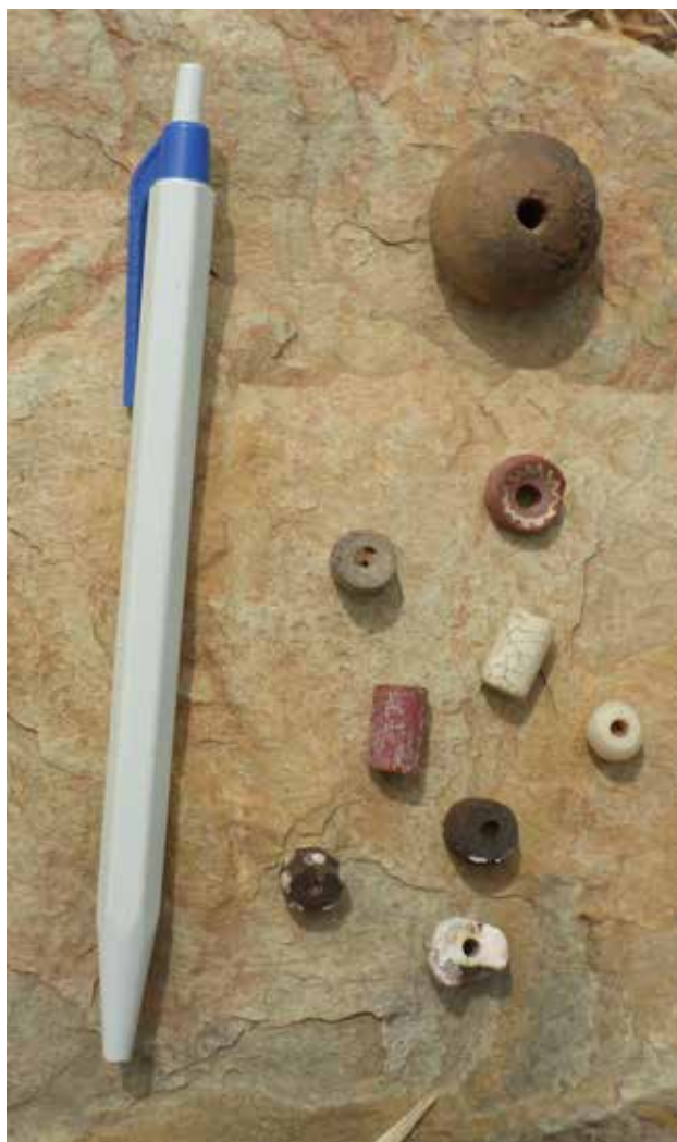
Figure 6.36. Darra-Lamine, perles de verre et fusaïole de terre cuite, ramassage de surface.

donne de Darra-Lamine concerne la taille du village, qu'il estime être un très grand village (Raffenel 1846 : 329), donc probablement un village peuplé et étendu.