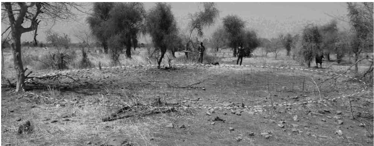
Figure 6.39. Demboube, vue générale du site du tata .