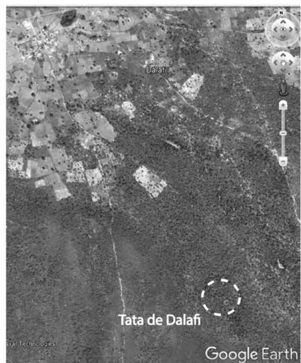
Figure 6.41. Dalafi, vue satellitaire de l'emplacement du tata .