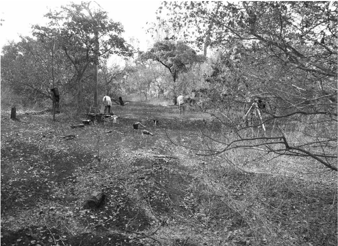
Figure 6.42. Dalafi, vue de l’empreinte sur le paysage, secteur ouest, à gauche se trouve le début de la butte, et à droite la forêt environnante ; tranchée de sondage en cours de nettoyage.