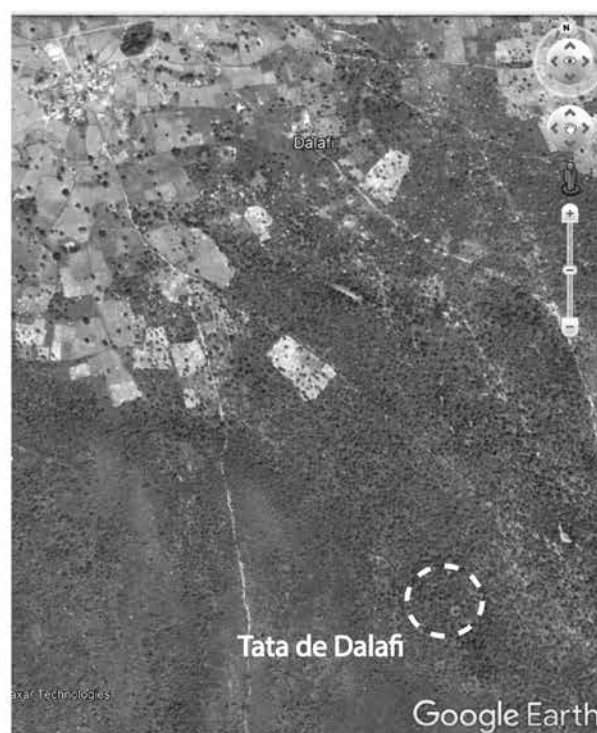
Figure 6.41. Dalafi, vue satellitaire de l'emplacement du tata .