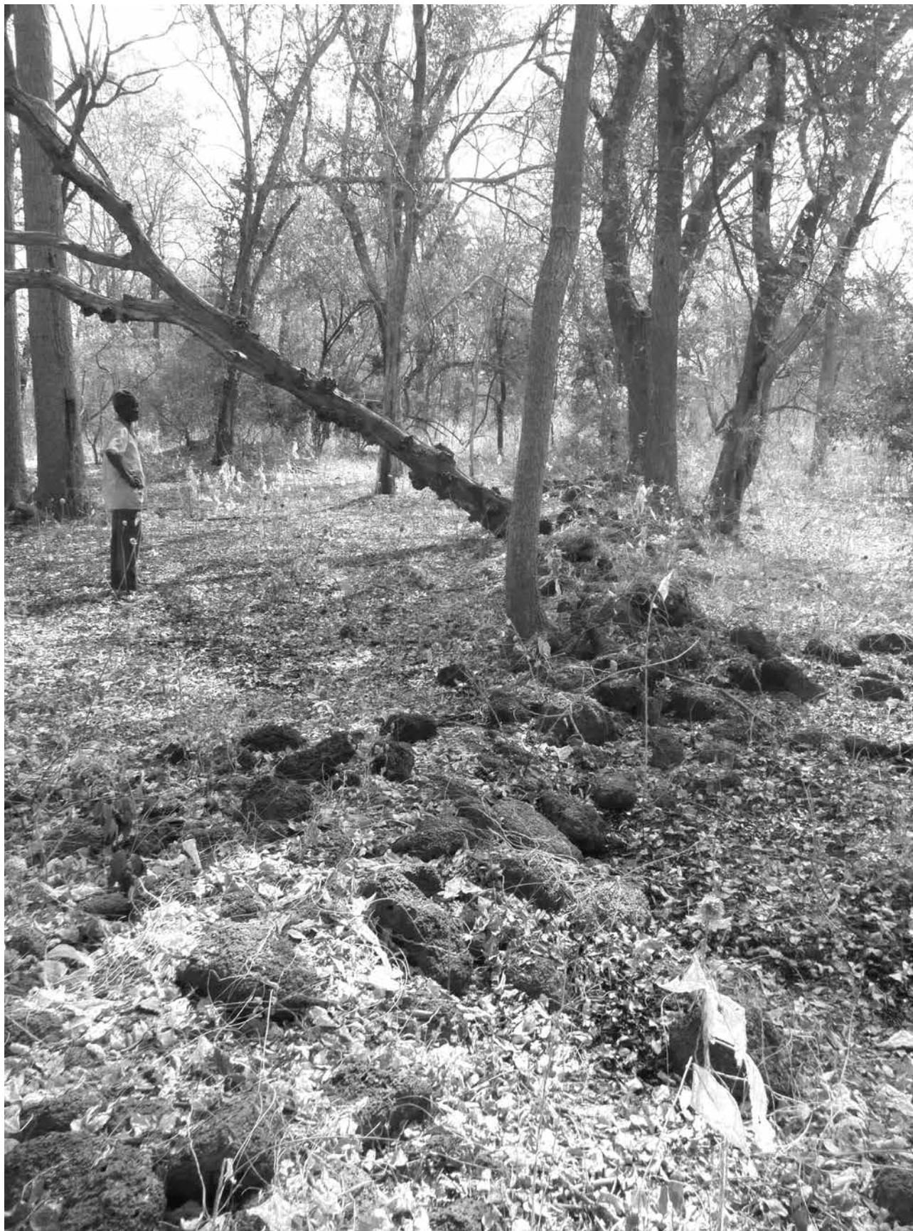
Figure 6.46. Tambataguela, vue de l'éboulis de la muraille.