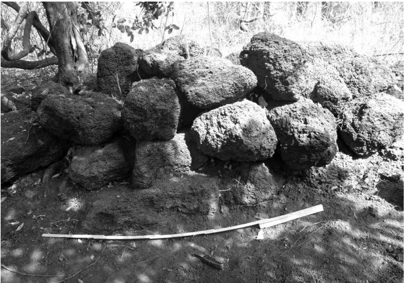
Figure 6.45. Tambataguela, vue des assises de la muraille.

Le matériel archéologique observable en surface, à l'intérieur comme à l'extérieur du tata , est principalement constitué de tessons de céramique (fig. 6.50). Ce sont des tessons peu épais, dégraisés à la chamotte et portant des